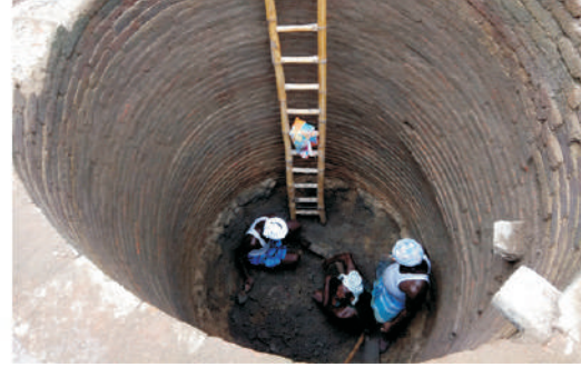
திருவள்ளூர் மாவட்டம், பட்டறைப் பெரும்புதூர் அகழாய்வில் கண்டுபிடிக்கப்பட்ட செங்கற்களால் ஆன கிணறு (சங்க காலம்), உறை கிணறு மற்றும் கூம்பு வடிவ தனித்தன்மை வாய்ந்த மட்பாண்டங்கள்