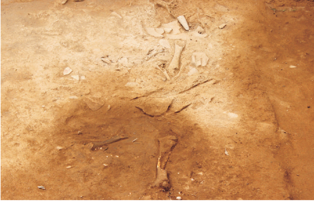
அகழாய்வுக் குழியில் வெளிப்பட்ட சிதறிக் கிடக்கும் விலங்கின் எலும்புத் துண்டுகள் – கீழடி, சிவகங்கை மாவட்டம்